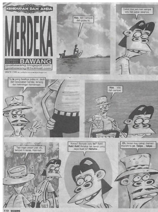
Rajah 4. Kehidupan dan Anda : Merdeka, 2009