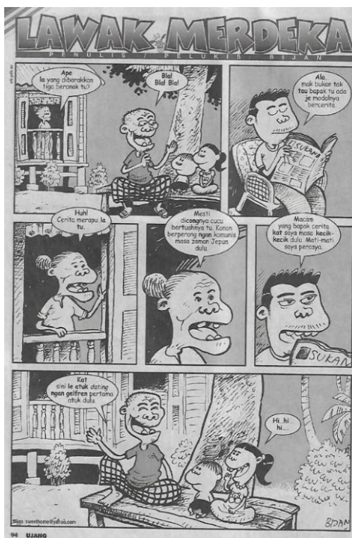
Rajah 3. Lawak Merdeka, 2009

kerana mereka masih berstatus bujang, keperluan seperti memasak tidak diutamakan dan mereka mencari idea untuk mendapat makanan percuma untuk berbuka puasa. Semasa pergi ke bazar Ramadhan mereka berdua telah terserempak dengan jirannya Noni, yang mempunyai fizikal berbadan besar. Mereka memuji Noni semakin cantik setelah berpuasa, termakan dengan pujian Cupin dan Dicky, kesemua makanan yang dibeli oleh Noni terus diberi kepada Cupin. Disebabkan itu mereka terus membuat taktik yang sama sehinggalah bulan syawal tiba. Oleh kerana mendapat makanan percuma pada setiap hari, fizikal Cupin dan Dicky mulai berubah daripada kurus menjadi gemuk. Mereka sangat menyesali perbuatan tersebut. Sambutan Hari Raya sangat dinantikan oleh semua lapisan masyarakat terutamanya kanak – kanak kerana suasana pada Hari Raya sangat meriah dan semua ahli keluarga dapat berkumpul di kampung halaman. Pelbagai makanan, pakaian, perabot baharu dapat dilihat pada hari tersebut, termasuklah orang yang tinggal di bandar turut akan pulang ke kampung. Ia menunjukkan persekitaran yang berwarna-warni dalam menyambut Hari Raya. Seperti yang ditunjukkan dalam kartun ‘Workshop’, pada bulan Ramadhan, banyak gerai atau bazar akan menjual pelbagai juadah makanan untuk berbuka puasa. Kartunis Sukun juga menunjukkan sesetengah gaya hidup masyarakat Melayu yang dilalui pada bulan Ramadhan iaitu walaupun sedang berpuasa, masih ada manusia yang bersikap tidak jujur iaitu melakukan perkara yang tidak baik seperti menipu.