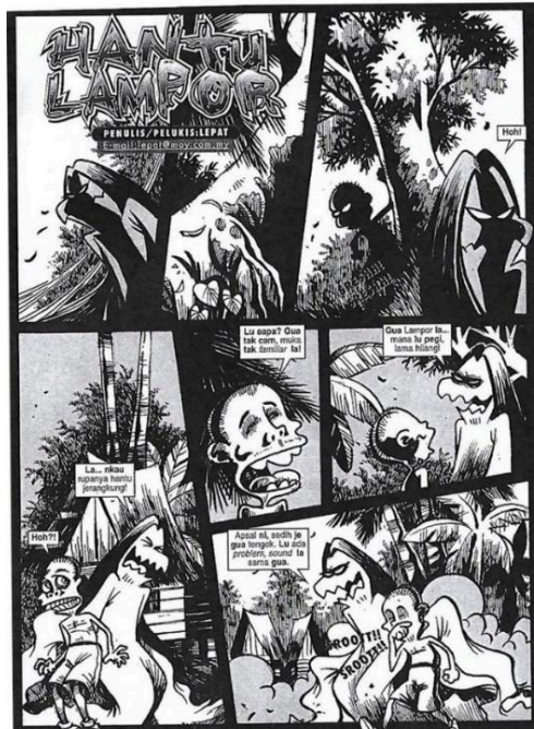
Rajah 5. Hantu Lampor, 2002

Bawang merujuk kehidupan sebenar masyarakat yang tinggal di bandar dan melalui pelbagai kesibukan kota.