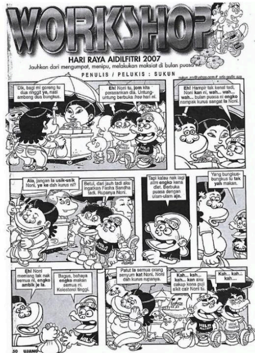
Rajah 2. Workshop , 2007

perihal hidupnya sebagai anak yatim, di mana ayahnya telah tiada. Kemudian, bosnya berasa simpati dan mahu menjadi ayah angkat kepada Mat. Mat sangat gembira, disebabkan sikap Mat yang bersahaja dan suka mengusik orang lain, Mat telah menghantar notis ke salah seorang staf di pejabatnya supaya berhenti. Berita tersebut telah sampai kepengetahuan ketuanya dan Mat telah dimarahi kerana membuat keputusan melulu atau sesuka hatinya. Alasan Mat adalah kerana dia adalah anak ketuanya di syarikat itu. Penggunaan bahasa tema tersebut menceritakan hubungan antara seorang pekerja dan ketuanya melalui pebagai cerita dan karakter. Selain itu, aspek sosio-budaya yang ditonjolkan dalam kartun oleh kartunis Lengkuas adalah memaparkan suasana masyarakat Malaysia iaitu mempunyai etnik berbilang kaum. Kartunis turut menunjukkan perpaduan masyarakat khususnya hubungan antara pekerja dalam bidang pekerjaan yang diceburi.