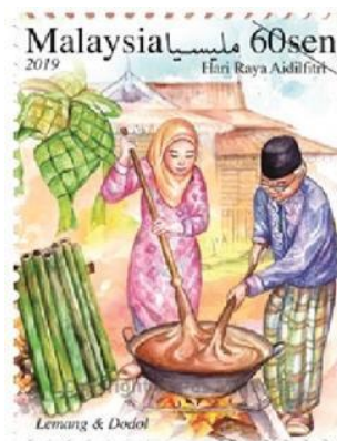
Rajah 10. Setem Aidilfitri 2019