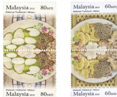
Rajah 3. Setem Aidilfitri 2010