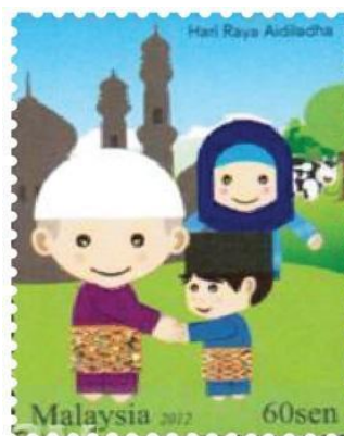
Rajah 5. Setem Aidilfitri 2012