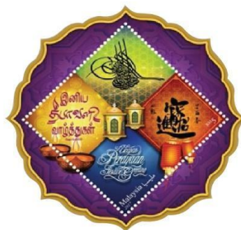
Rajah 7. Setem Aidilfitri 2017