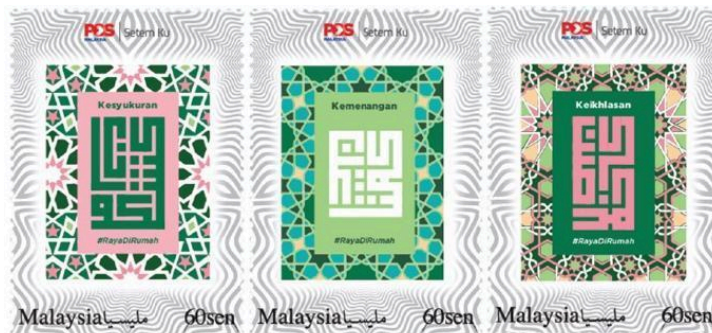
Rajah 11. Setem Aidilfitri 2020