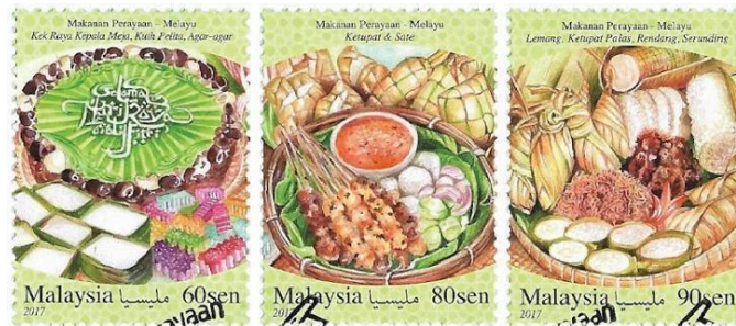
Rajah 9. Setem Aidilfitri 2017