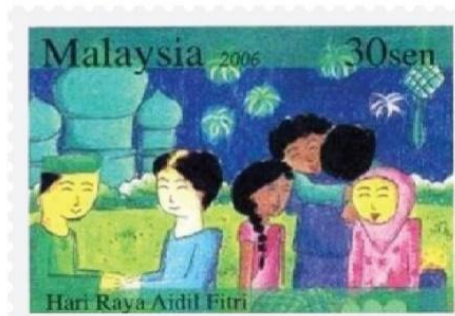
Rajah 2. Setem Aidilfitri 2006