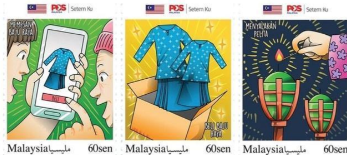
Rajah 13. Setem Aidilfitri 2021