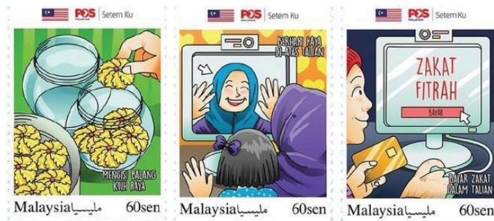
Rajah 12. Setem Aidilfitri 2021