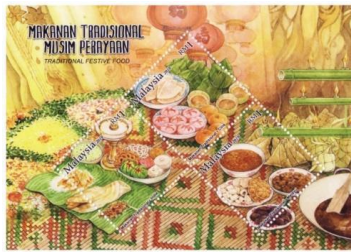
Rajah 4. Setem Aidilfitri 2010