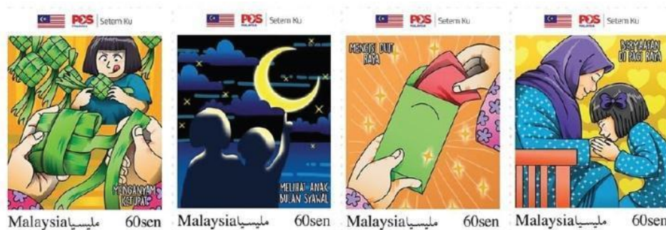
Rajah 14. Setem Aidilfitri 2021