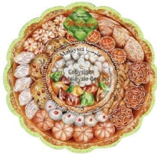
Rajah 8. Setem Aidilfitri 2017

setem Aidilfitri yang menggunakan tulisan khat berwarna hitam dan mempunyai latar belakang tona hijau dan kuning.