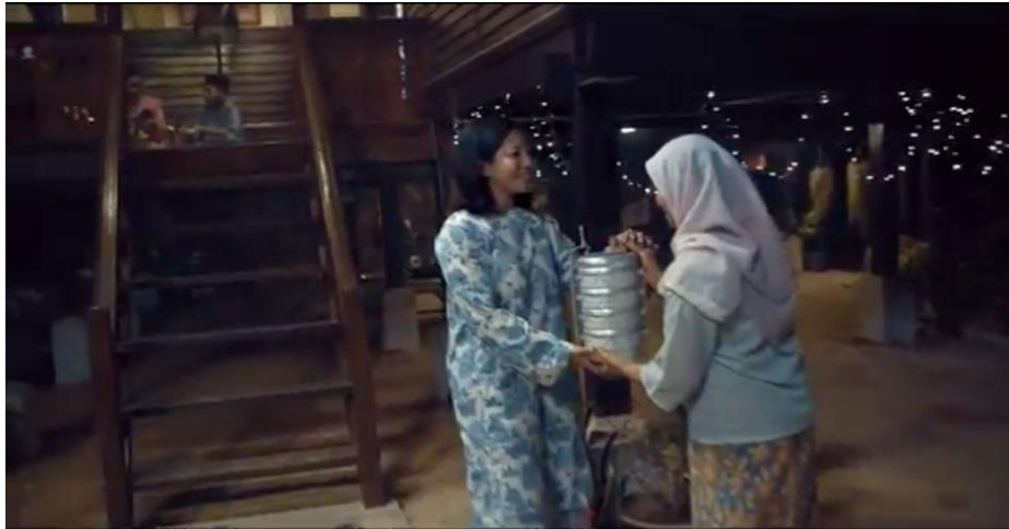
Rajah 10. Mangkuk tingkat (minit 00.00.42)