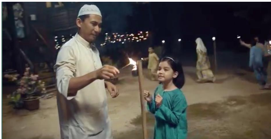
Rajah 9, Pelita Panjut (minit 00.00.36)

Bunga api menjadi tradisi semasa sambutan hari raya. Didalam Rajah 9 (minit 00.00.36), si bapa menyalakan bunga api dan beberapa orang dilihat memasang Pelita Panjut. Bunga api dan Pelita Panjut memberi cahaya kemeriahan suasana sambutan hari raya di kampung. Dari sudut semiotik Bunga api dan Pelita Panjutt boleh ditafsirkan sebagai suatu harapan dan wawasan yang akan sentiasa menyinar kehidupan.