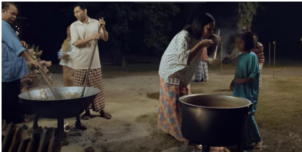
Rajah 4. Shot# 2/ minit 00.00.27

seorang dewasa sedang duduk di kerusi rotan dan membaca surat khabar, kemudian ke arah seorang lelaki sedang minum kopi sambil berbual dengan seorang wanita di ruang tamu. Di bahagian latar, kelihatan sebuah peti televisyen lama) yang sedang menayangkan rancangan tempatan tetapi tidak ditonton oleh sesiapa. Fokus kamera beralih ( shift ) kepada si bapa yang muncul dari luar rumah dan berjalan ke arah kanan melewati dua remaja perempuan yang sedang memasang sarung bantal. Pada saat itu, si ibu muncul dari bilik dan si bapa memetik suis lampu dan memasuki ke dalam bilik. Si ibu melutut sambil menyarung selimut pada si anak yang sedang tidur. Fokus kamera beralih kepada bahagian kaki si anak yang memakai kasut berwarna merah dan kelihatan kanak-kanak sedang tidur di ruang tengah rumah. Selepas itu kamera mula bergerak ke kanan dan fokus beralih ke arah tingkap.