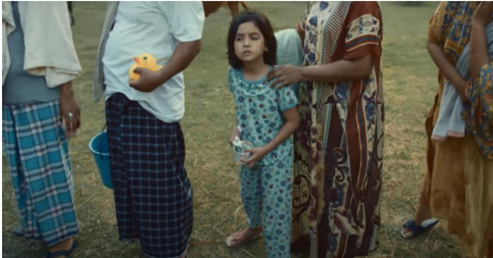
Rajah 5. Shot #3 ( minit 00.01.33)