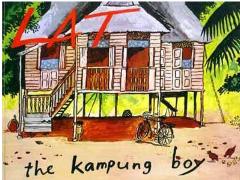
Rajah 1. Kulit buku The Kampung Boy Berita Publishing, 2009

dalam peribahasa tersebut dirujuk sebagai sebuah negeri iaitu tanah kelahiran. Peribahasa tersebut juga mengingatkan orang Melayu supaya sentiasa berhati hati agar maruah dan warisan mereka tidak hilang begitu sahaja. Justeru tidak hairanlah mengapa imej kampung sering diabadikan oleh para seniman dalam puisi, novel, lagu, filem, teater, animasi dan lukisan. Misalnya, gambaran seperti pokok kelapa, rumah papan, anak sungai, gunung-ganang sawah padi, binatang ternakan adalah antara elemen-elemen visual dan naratif yang sering dimanifestasikan. Mungkin ada yang berpendapat elemen-elemen tersebut adalah klise atau stereotaip, namun realitinya ia masih dianggap relevan dan menjadi “modal seni” kepada golongan seniman. Sebagai contoh kartunis tersohor Malaysia, Datuk Lat telah menzahirkan rasa bangga terhadap imej kampung yang diceritakan melalui buku beliau The Kampung Boy (Shahril Adzrin, 2009). Pengalaman membesar sebagai anak kampung telah memberi kelebihan pada beliau untuk berkarya, mencipta nama dan mendapat pengiktirafan bukan sahaja di Malaysia malah di peringkat global. Lakaran imej kampung dalam kulit buku The Kampung Boy sangat stailistik dan naif tetapi jujur dan sentimental. Representasi kehidupan di kampung menghiasi setiap frem dan menyorot kisah-kisah peribadi Datuk Lat bersama keluarganya.