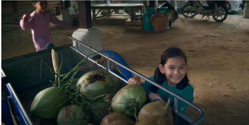
Rajah 7. Shot# 5 (minit 00.02.21)

menunggu untuk mengambil Rajah. Kamera mula bergerak dan fokus terarah pada keluarga pada bahagian hadapan dengan belatarbelakangkan rumah kampung. Kelihatan di sudut kiri dan kanan frem terdapat kenderaan mewah milik keluarga. Shot ini berakhir dengan kata-kata hikmah “Kenangan semalam mengisi makna hari ini. Membawa harapan hari esok”.