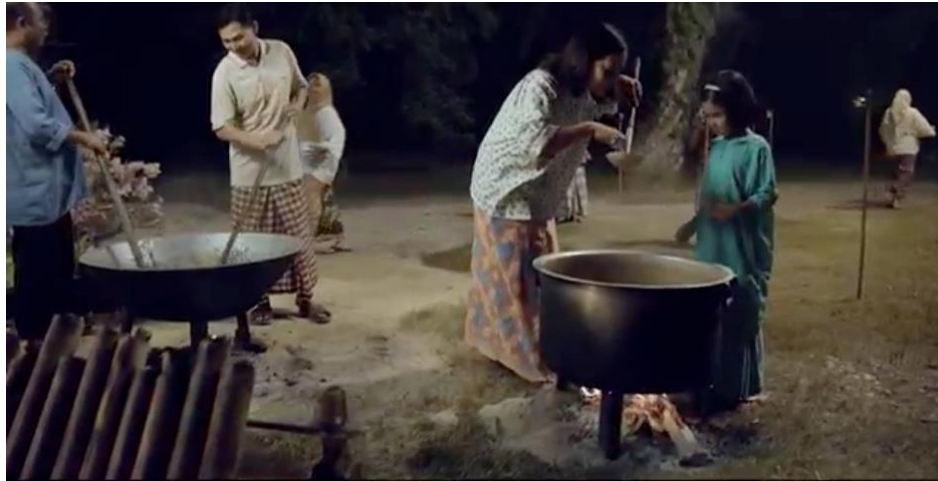
Rajah 8. Ketupat, Lemang, Dodol & Rendang minit 00.00.27