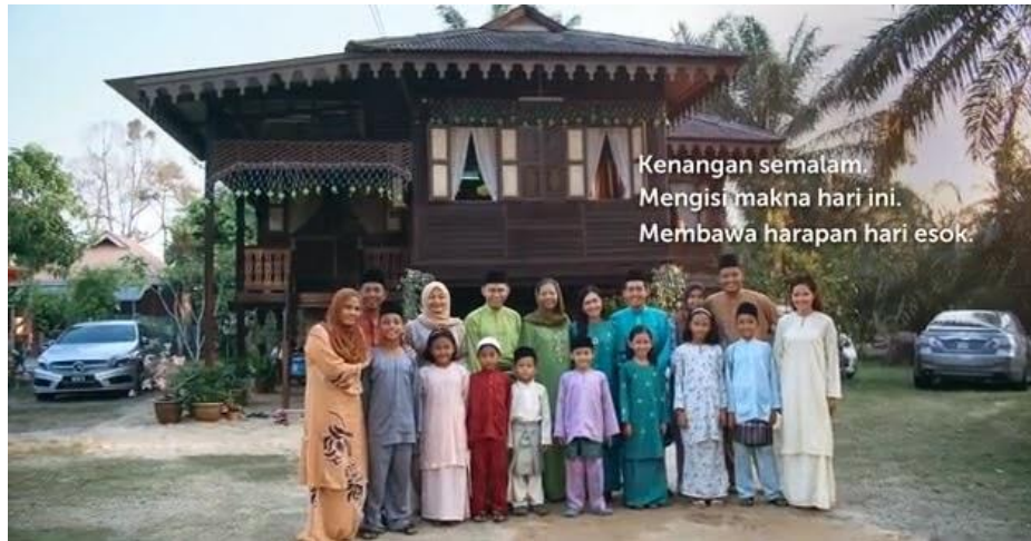
Rajah 12. Rumah Kampung (minit 00.02.38)