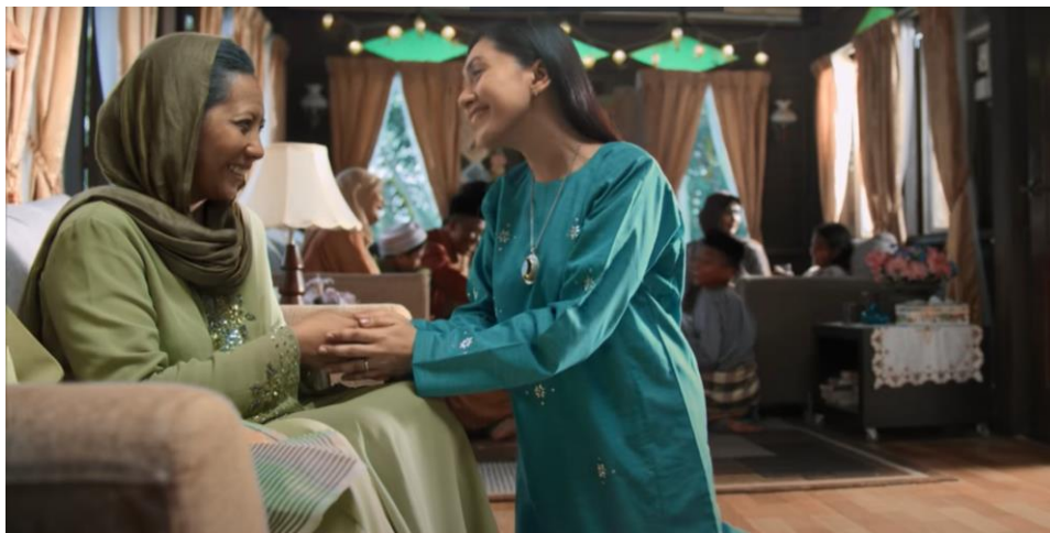
Rajah 6. Shot# 4 (minit 00.02.07)

Dalam Rajah 6, Shot# 4 (minit 00.01.33), si anak telah berubah menjadi seorang wanita. Dari sudut semiotik Shot ini memberi maksud tentang tranformasi. Sudut pandangan rendah ( Low Angle View ) berubah secara perlahan kepada sudut pandangan mata ( eye level view ). Setelah selesai mencium tangan, si anak bangun dan menjemput tetamu masuk ke rumah. Kamera mula bergerak ke kiri dan fokus beralih ( shift ) pada beberapa keping Rajah keluarga di atas almari. Selepas seketika, kamera mula bergerak ke bawah melepasi lantai rumah.