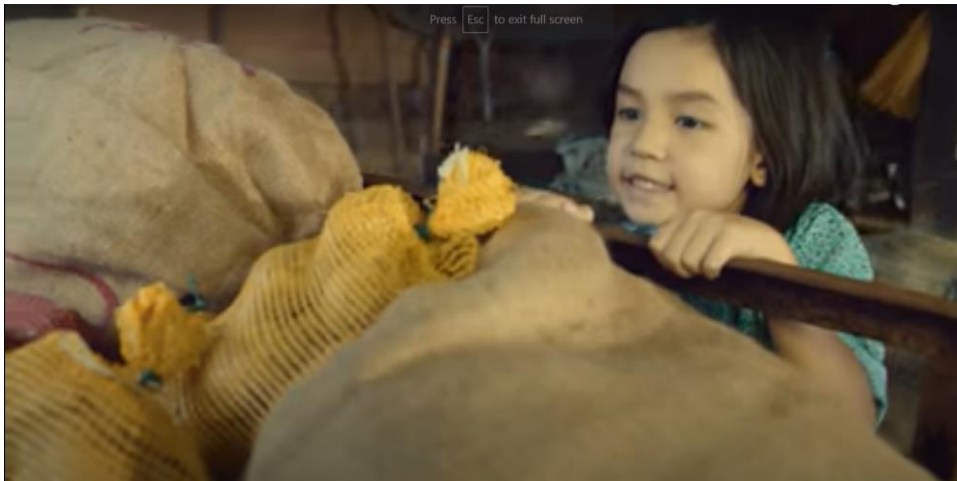
Rajah 3. Shot # 1 ( minit 00.00.01)

Berlatarbelakangkan suasana ( setting ) tahun 80-an (dikenal pasti melalui tona warna sephia), visual dalam Shot #1 (Rajah 3) bermula dengan sudut pandangan rendah ( low angle view ) memaparkan seorang kanak-kanak perempuan (si anak) sedang bersembunyi di sebalik beberapa timbunan goni berisi bawang di bawah kolong rumah. Sejurus selepas itu, si anak bangun dan mula berlari ke arah kamera dan terus keluar dari sudut kanan frem. Di bahagian latar kelihatan tiga kanak-kanak lelaki sedang berlari dan bermain “Teng Teng” (sejenis permainan tradisi). Fokus kamera beralih arah ( shift ) kepada seorang wanita (si ibu) yang sedang menganyam ketupat. Si ibu memanggil si anak dan memakaikan “scarf” kepadanya dan kemudian menyambung semula kerja menganyam ketupat. Semasa kamera mula mengezum jauh ( zoom out ), seorang lelaki (si bapa) muncul dari sudut sebelah kanan frem melangkah ke kanan untuk mengambil sangkar ayam yang tergantung pada tiang rumah. Dia kemudiannya berjalan ke hadapan dan memerangkap beberapa ekor ayam yang berada di laman rumah. Kelihatan si anak dan dua orang kanak-kanak lelaki (saudara) yang juga cuba untuk mengepung ayam tersebut. Kamera mula bergerak secara melintang dan kelihatan tiga orang dewasa sedang mengisi beras pulut ke dalam buluh Lemang. Pergerakan kamera ( Camera Movement ) menjadi perlahan dan fokus beralih ( shift ) kepada beberapa batang Lemang yang sedang dibakar.