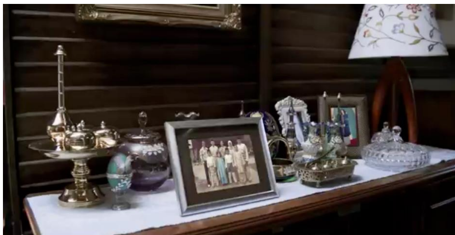
Rajah 11. Perhiasan Tembaga minit 00.02.16

Perhiasan tembaga adalah salah satu objek yang diminati orang kampung. Permukaannya yang berkilat dan keperangan menambah seri selain menunjukkan status tuan rumah. Dalam iklan video ini, perhiasan tembaga seperti tepak sirih, dulang beserta bekas untuk mengisi air mawar dan kendi air ditonjolkan sebagai harta pusaka keluarga yang dipelihara turun temurun. Dalam konteks ini, ia boleh disama ertikan dengan aset warisan.