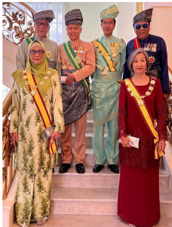
Gambar 5. Kelihatan Yang Amat Mulia Tunku Zain Al'Abidin (dua pada barisan kedua dari kanan) memakai Songket Tenggarung semasa upacara di Istana Besar Seri Menanti, Negeri Sembilan