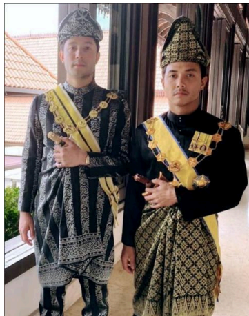
Gambar 6. Kerabat bergelar bagi negeri Pahang Darul Makmur (dua dari kanan) memakai pakaian Diraja yang diperbuat daripada Songket Tenggarung atau berjalur

Kain Tenggarung menjadi pilihan dengan terdapatnya kepelbagaian dalam kontek sosio budaya telah bercampur baur di kalangan orang Melayu sejak era kegemilangan Kesultanan Melayu-Melaka pada sekitar abad ke-15 Masihi. Pemakaian kain Tenggarung ini menjadi satu kebiasaan yang digunakan oleh anak Raja bergelar dan bangsawan Melayu sebagai pakaian rasmi semasa menghadiri upacara Diraja. Selain itu, kain Tenggarung juga memberikan satu bentuk perlambangan dari aspek sosio budaya serta merujuk kepada status dan tahap kebangsawanan di kalangan kerabat Diraja Melayu. Ini jelas menunjukkan bahawa pemakaian pakaian Diraja Melayu ini telah menjadi lambang serta mengandungi nilai sosial kepada Kesultanan Melayu di Semenanjung Tanah Melayu. Gambar 6.0 menunjukkan seorang Putera Raja Pahang dengan memakai persalinan lengkap pakaian Diraja yang diperbuat daripada kain Tenggarung.