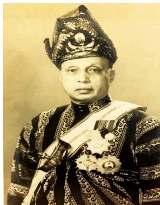
Gambar 3. Kebawah Duli Yang Maha Mulia (K.D.Y.M.M) Almarhum Sultan Sir Abu Bakar Ri'ayatuddin Al-Mu'azzam Shah Ibni Almarhum Sultan Abdullah Al-Mu'tassim Billah Shah (1904 – 1974) memakai pakaian Diraja Pahang yang diperbuat daripada kain Tenggarung

Institusi beraja Melayu di Semenanjung Tanah Melayu telah mempunyai pakaian Dirajanya yang tersendiri. Songket Tenggarung telah menjadi pakaian Diraja yang telah di pakai oleh golongan bangsawan dan kerabat Diraja Melayu sejak awal abad ke-18 Masihi lagi. Pakaian Diraja Melayu yang menggunakan kain Tenggarung telah menjadi pakaian Diraja bagi Putera Raja serta anak Raja bergelar di negeri Pahang, Negeri Sembilan, Selangor dan Kedah. Rekod visual juga menunjukkan bahawa pemakaian pakaian Diraja Melayu yang diperbuat daripada kain Tenggarung telah dipakai semasa adat upacara pertabalan Diraja, hari keputeraan Diraja dan acara rasmi Diraja Melayu. Di negeri Pahang pula kain Tenggarung telah menjadi pakaian rasmi yang telah dipakai oleh Kebawah Duli Yang Maha Mulia (K.D.Y.M.M) Almarhum Sultan Sir Abu Bakar Ri'ayatuddin Al-Mu'azzam Shah Ibni Almarhum Sultan Abdullah Al-Mu'tasim Billah Shah (1904–1974) dan baginda tuanku telah memakai sepersalinan pakaian Diraja Pahang yang mengandungi satu set lengkap pakaian Diraja iaitu: Baju Melayu, sampung, bengkung dan tengkolok. Gaya pemakaian pakaian Diraja Pahang ini masih kekal diwarisi dan diamalkan oleh Putera Raja bergelar bagi negeri Pahang kini.