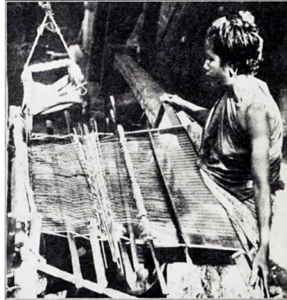
Gambar 1. Penenun kain di Tanah Melayu sekitar tahun 1900

Aziz (2018) menjelaskan bahawa pusat tenunan tradisi Melayu adalah di kawasan pantai timur Semenanjung Tanah Melayu iaitu di Kelantan dan Terengganu kerana di kedua-dua kawasan tersebut sehingga kini masih terdapatnya para penenun tradisi Melayu yang menghasilkan tekstil tenunan tradisi Melayu. Fakta menyatakan bahawa, teknik serta kemahiran tenunan tekstil tradisi Terengganu telah menyebar ke kawasan Kesultanan Melayu-Riau dan Kesultanan Melayu-Siak sekitar abad ke-18 masihi. Fakta ini di sokong oleh Nawawi (2007) dengan menyatakan bahawa kemahiran serta kesenian pembuatan tekstil tradisi tenunan Melayu-Terengganu telah dibawa masuk ke kedua-dua daerah Kesultanan Melayu tersebut daripada Terengganu semasa era pemerintahan Sultan Mansur Riayat Syah I ibni Almarhum Sultan Zainal Abidin Shah I (1725 Masihi – 1798 Masihi), baginda Almarhum Tuanku juga dikenali sebagai Tun Dalam atau Marhum Janggut. Dikatakan bahawa baginda berkahwin dengan seorang puteri Diraja Kesultanan Melayu-Riau dan telah membawa masuk para penenun daripada Terengganu ke Riau bagi mengajar para penenun di situ. Ini jelas menunjukkan terdapat persamaan daripada aspek pembuatan tekstil tradisi Melayu khususnya Songket. Persamaan yang ketara juga boleh didapati pada penggunaan alat tenunan yang dikenali sebagai ‘kek’ yang merupakan alat tenunan tekstil tradisi Melayu.