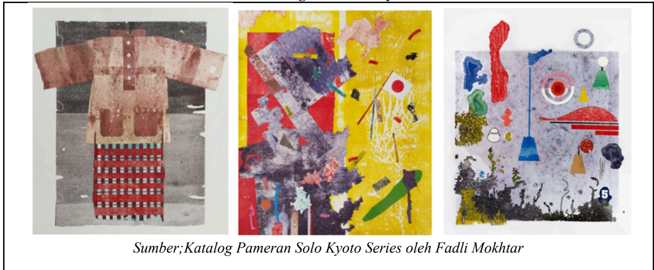
Jadual 2. Elemen Ekologi Dalam Karya Fadli Mokhtar

Bagi menghuraikan pengaruh ekologi terhadap karya, Jadual 1 memperincikan maklum balas informan melalui sesi temubual yang telah dijalankan. Maklumat yang diperolehi menggambarkan faktor persekitaran yang mempengaruhi proses kreatif dalam penghasilan karya seni secara menyeluruh.